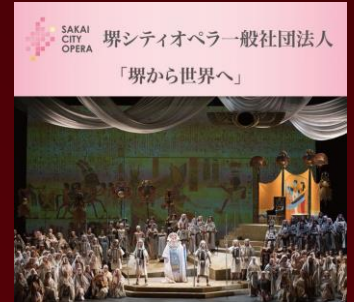
大阪府堺市北区百舌鳥赤畑町4-256 TEL: 072-254-1151 http://sakai-city-opera.jp/