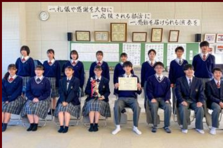
千葉県松戸市立松戸高等学校合唱部 高校生アンサンブル部門