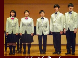
山ちゃんチーム 重唱部門