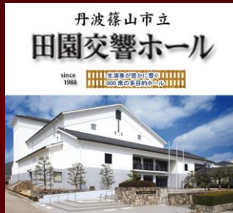
兵庫県丹波篠山市北新町41 TEL: 079-552-3600 www.city.tambasayama.lg.jp/denen/